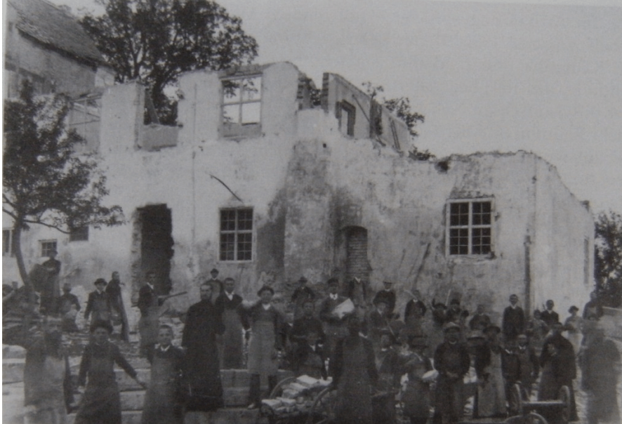
Vetus Ambingense castellum diruitur. [Maria HILDEBRANDT (2008), p. 13.]

Alterā ex parte confratribus suis Ottilianis de sequelis severis huius colloquii cum episcopo habiti nihil rettulit, sed domum reversus solum de bono effectū consultationis narravit. 105 Insuper - quod similiter mirum est - P. Andreas