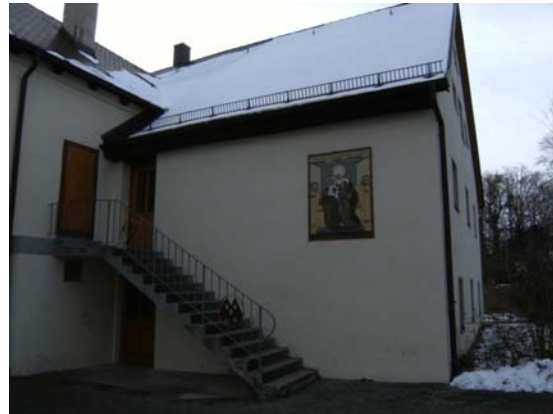
Aedificium «Sanctae Annae».

In initio sorores parte occidentali castelli Ambingensis usae sunt, ubi pedepianis culina atque cenatio sitae erant, in primo tabulato sororum oecus communis, conclave superiorissae, conclave aegrotis destinatum atque similia erant, et in tabulato subteglaneo sororum oecus dormitorium inveniebatur. Condicio quidem erat melior quam Richopagi, sed iam paulo post iterum angustiae quaedam animadvertebantur, cum numerus sororum continuo augeretur. In fine anni 1888 i videntur iam triginta sex sorores candidataeque adfuisse. 29