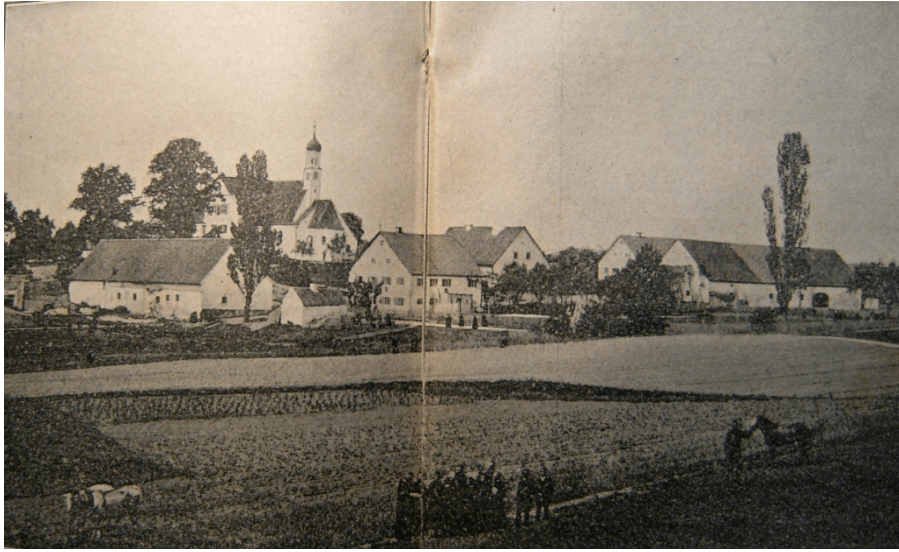
Ambinga anno 1887 o recepta.

tabulato primo P. Andreas Amrhein duo conclavia habuit; in secundi tabulati «oeco equitum», qui dicitur, consessūs communitatis exhibebantur; in castelli parte occidentali sororibus separatus oecus quidam habitandi praebebat. Pernoctaverunt autem sorores postmodum in aedificio, quod antea erat praedium Baderianum, quod primo «St. Andreas», deinde aliquando «St. Anna» appellabatur. Fratribus vero in superiore tabulato praedii Ammeriani oecus dormitorius instituebatur. 39 Tamen celeriter apparuit locum pro coetū crescente revera non sufficere.