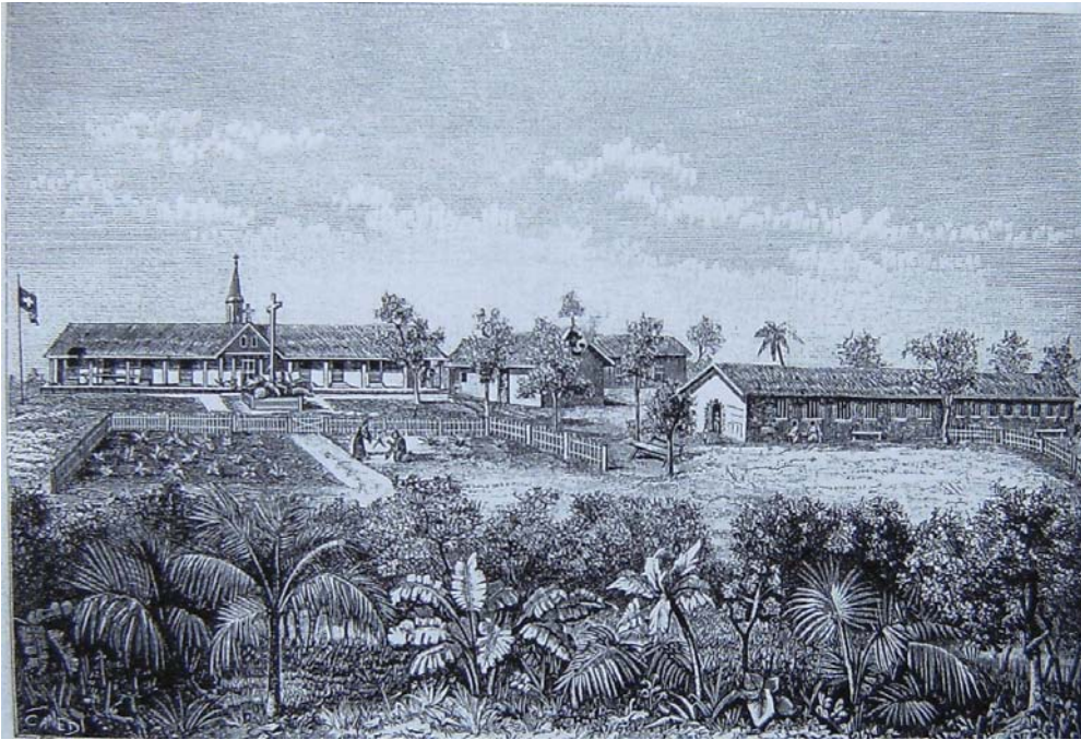
Delineatio Africani monasterii Sancti Benedicti in loco Pugu siti. [Missionsblätter 1890, coll. 67/68.]

Mensibus autem insequentibus plura aedificia firma exstruebantur, ita ut monasterium Sancti Benedicti constitit ex cappellā, ad cuius partem sinistram coenobium sororum 125 adiunctum erat, ad partem dexteram coenobium fra-