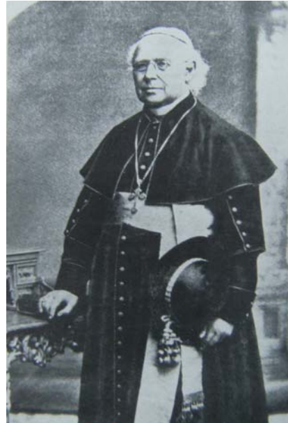
Pancratius von Dinkel, episcopus Augustanus. [Cfr Frumentius RENNER, Leuchter I (21979), p. B 6.]

Illum locum, quem P. Andreas Amrhein quaesivit, mirum in modum satis celeriter invēnit in dioecesi Augustanā. 1 Episcopus illius dioecesis tunc temporis erat Pancratius von Dinkel. 2 Qui vir ecclesiasticus non solum ordinibus monasticis favit, sed etiam missio Christiana ei erat cordi. Itaque erat coincidentia vere opportuna, quod occasione, quā episcopus Pancratius Magnum Fleschutz sacerdotem ordinavit, 3 P. Andreas Amrhein cum episcopo Augustano con-iunctionem inire valuit. Videtur autem idem episcopus, cum inceptum P. ris Andreae Amrhein ipsi placeret, iam illo tempore ei bona consilia dedisse vel fortasse revera eum invitavisse, ut in dioecesi Augustanā sedem secundariam domūs missionariae conderet. 4 Tamen hanc