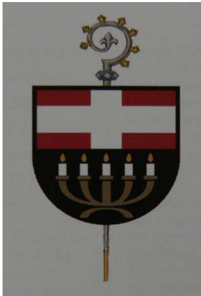
Insigne archiabbatiae Ottiliensis. [Cfr MISSIONSBENEDIKTINER. Ein Klosterführer durch vier Kon- tinente. St. Ottilien 2008, p. 3.]

scopo missionario. Nam hęc insigne 31 bipartitum est, in cuius superiore parte rubro conspicitur lata crux argentei coloris. In inferiore parte nigrā exhibetur