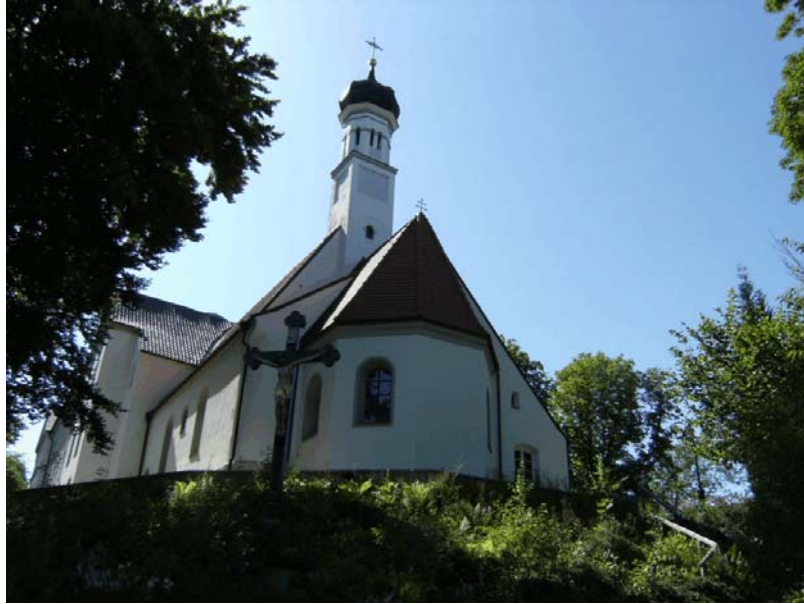
Exterior pars cappellae Sanctae Ottiliae ex oriente receptae. Structura externa decursu temporis non erat mutata.

Cum propria ecclesia pro domo missionariā P.ri Andreae Amrhein esset maxime cordi, haec rogatio ad usum cappellae Sanctae Ottiliae spectans erat alicuius momenti. Itaque episcopus Pancratius von Dinkel consultationes cum